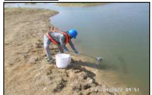
ภาพถ่ายจุดตรวจวัด

(รับรองผลเฉพาะตัวอย่างที่ได้วิเคราะห์/ทดสอบเท่านั้น)